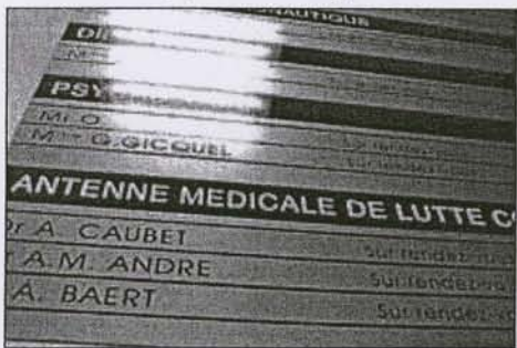
Des « Antennes médicales de lutte contre le dopage » ont été créées il y a cinq ans pour développer entre autres la prévention.

« Antennes médicales de lutte contre le dopage ». Il y a cinq ans, la loi Buffet en a créée une dans chaque région. L'objectif : développer la prévention et l'accompagnement médical au même titre que la répression. Faute de moyens spécifiques, leur action et leur bilan restent bien modestes.