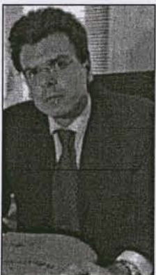
Thibault de Montbrial est devenu un spécialiste des affaires de dopage dans le sport.

« Oui. Le monde du sport est constitué de strates successives sportif-entraîneur-dirigeant qui constitue une véritable contre-culture, un milieu fermé pour l'extérieur, avec la complicité de médias complaisants. Le sportif qui gagne, il a l'argent, la gloire et toutes les femmes qu'il veut. La tentation est d'autant plus grande que généralement les sportifs viennent de milieux modestes et ont arrêté les études très jeunes. Quelqu'un qui a bac + 4 a les moyens de com-